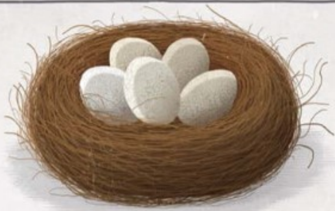
Stadionul olimpic din Beijing are forma unui cuib de pasăre.