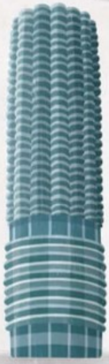
Blacul zgârie-nori Marina City din Chicago este construit după modelul unui cocoon de porumb.