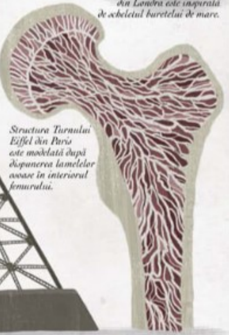
Structura Turnului Eiffel din Paris este modelată după dispunerea lamelilor osoase în interiorul femurului.

surfing și multe alte obiecte. Fagurele de miere e doar una dintre soluțiile verificate de natură și care i-au inspirat pe ingineri. Primele cuțite de piatră ale strămoșilor noștri au fost cioplite după modelul dinților animalelor de pradă, iar sursa de inspirație pentru coșurile împletite au fost cuiburile de păsări. Când Gustave Eiffel a proiectat celebrul turn din Paris, s-a inspirat din lamellele osoase care alcătuiesc femurul uman. Alți arhitecți au luat ca