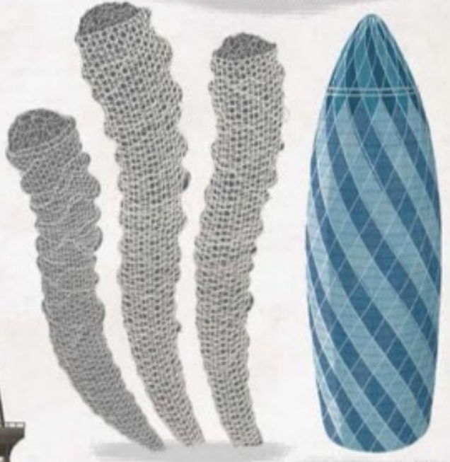
Structura Turnului Gherkin din Londra este inspirată de scheletul buretelui de mare.