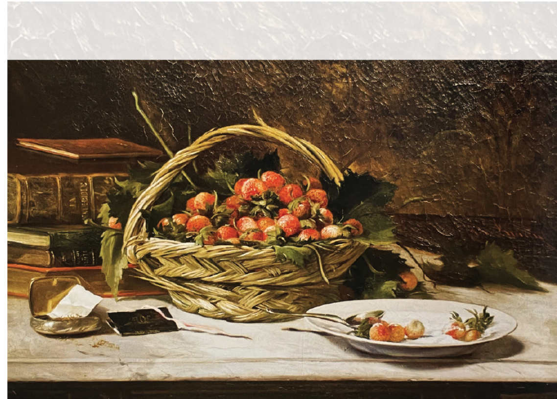
THEODOR AMAN, Coș cu fragi

Theodor Aman este primul pictor român care studiază la Școala Națională Superioară de Arte Frumoase din Paris, într-o perioadă în care doar portretul și scenele istorice sau cele inspirate din mitologie erau considerate genuri artistice majore. La revenirea din Franța, el se va ocupa, precum toți artiștii importanți ai vremii, în principal de aceste genuri de pictură. NATURA STATICĂ și PEISAJUL vor primi atenția cuvenită din partea pictorului mult mai târziu. Elementele pe care le întâlnim în compozițiile sale cu flori și fructe reproduc aproape fotografic realitatea, precizia desenului fiind una dintre calitățile de necontestat ale artistului.