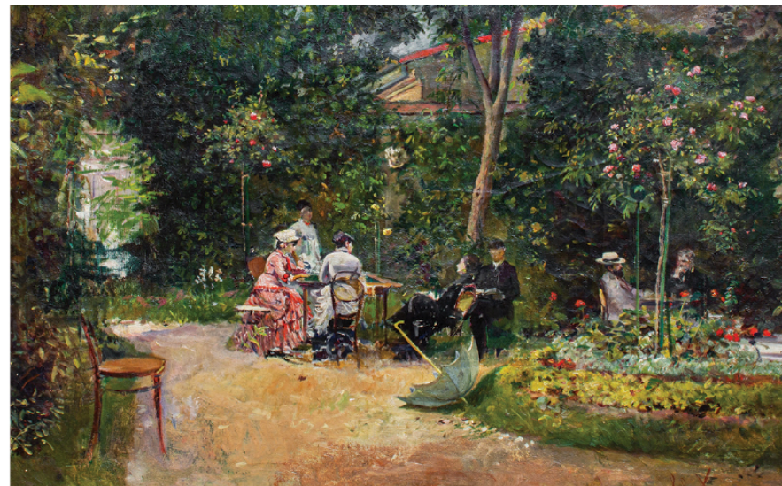
THEODOR AMAN, În grădina autorului

Din patrimoniul MUZEULUI THEODOR AMAN, MUZEUL MUNICIPIULUI BUCUREȘTI ©