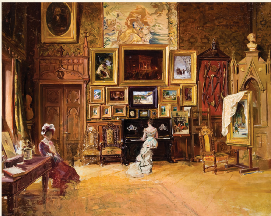
THEODOR AMAN, În atelierul artistului

Deși a rămas orfan de tată încă de la vârsta de trei ani, Theodor Aman a avut privilegiul de a primi o educație aleasă, moștenind pasiunea pentru MUZICA CLASICĂ de la mama lui. El însuși cânta adesea la VIOLONCEL (instrument expus în prezent la MUZEUL THEODOR AMAN ) în cadrul diferitelor recepții, serate muzicale sau baluri costumate pe care le găzduia în atelierul său. La una dintre aceste serate, artistul a cântat chiar în prezența reginei Elisabeta, prima regină a României, renumită pentru contribuția sa la susținerea și promovarea culturii române.