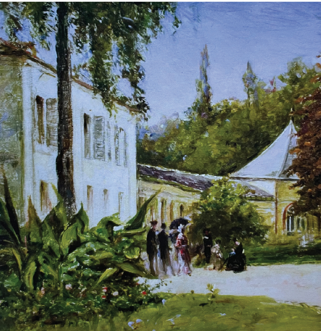
THEODOR AMAN, Plimbare in parc

Din patrimoniul MUZEULUI THEODOR AMAN, MUZEUL MUNICIPIULUI BUCUREȘTI ©