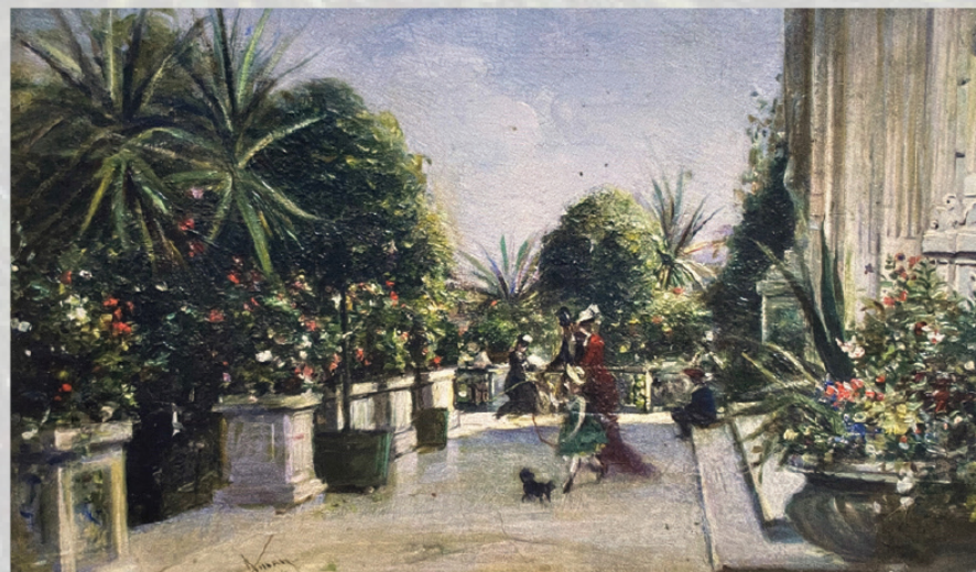
THEODOR AMAN, Peisaj (pe terasă)