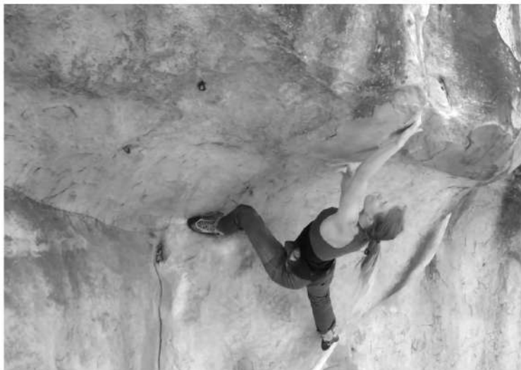
FIGURA 1. Stânca Le Toit du Cul de Chien – punctul crucial