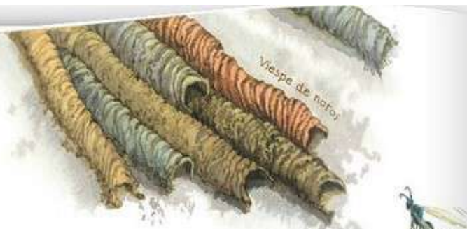
Viespe de națor