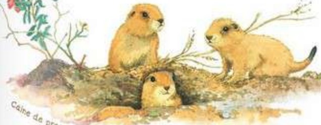
Caine de prairie cu coada neagra

dar numai până când aceștia sunt gata să zboare, să inoate sau să se tărăscă mai departe.