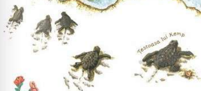
Testoasa lui Kemp