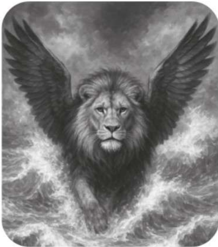
Fiara 1: Leul înaripat (Împărăția Babilonului)

copilăriei mele. Nu știu dacă am ațipit sau nu, dar așa cum eram, am simțit că Dumnezeu a pus stăpânire pe gândurile sau pe visul meu. Ochii mei priveau Marea cea Mare și vedeam cum valurile ei erau din ce în ce mai agitate, când, deodată, au apărut din ea patru fiare, deosebite total una de cealaltă. Prima fiară semăna cu un leu și avea aripi de vultur. Am văzut însă cum, după un timp, i s-au smuls aripile și cum ea s-a ridicat pe două picioare, ca un om.