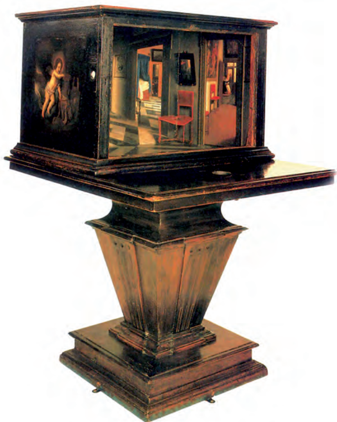
5. Samuel van Hoogstraten, Cutie perspectivă cu vedere într-un interior olandez , National Gallery, Londra.

au tematizat și integrat tema voyeurului, al cărei reprezentant-cheie va fi – printre alții – Hitchcock. În această „preistorie“ a cinematografului, „cutiile perspective“, așa cum ni le-a transmis arta olandeză a secolului al XVII-lea, joacă un rol aparte (il. 5). Aceste dispozitive dezvoltă datele tabloului olandez de interior, pe care-l