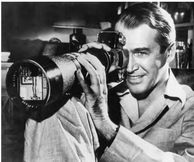
1. Fotografie publicitară pentru filmul Fereastra din spate (1955), colecția autorului.

Atenția lui, protezele oculare și imaginația ajung să-l convingă că la familia Thorwald lucrurile au luat o întorsătură urâtă și că ar fi avut loc o crimă. În căutare de probe, îi antrenează în ancheta lui pe Lisa (logodnica sa), pe infirmiera Stella și pe un vechi prieten, Tom Doyle.