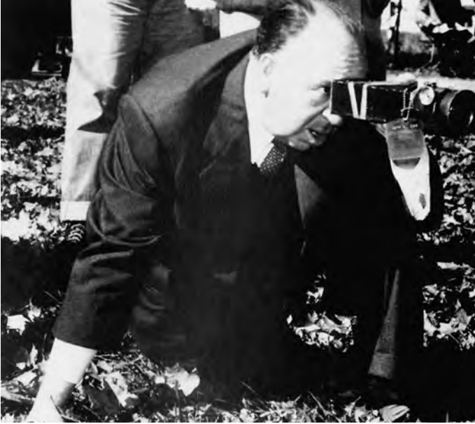
4. Hitchcock la lucru , fotograf neidentificat, an necunoscut.

a cărei esență este, înainte de orice, fotografică. Rădăcinile sale sunt însă mult mai profunde – ele se află în tradiția occidentală a „tabloului“ (il. 2 și 3) – și vizează totodată noua figură emblematică a celui care captează imagini, în special aceea a realizatorului cinematografic (il. 4). Ambele – tradiția și rezultatul final – sunt marcate de pulsuni la limita avuabilului și a fost nevoie de munca de pionierat a lui Jacques Lacan pentru a ne face să acceptăm latura libidinală, partea de „dorință“ legată de orice demers vizual. 9 E de ajuns să examinăm pe scurt punctele în care istoria picturii și preistoria cinematografului se intersectează pentru a înțelege importanța și modul inevitabil în care arta și mediile optice