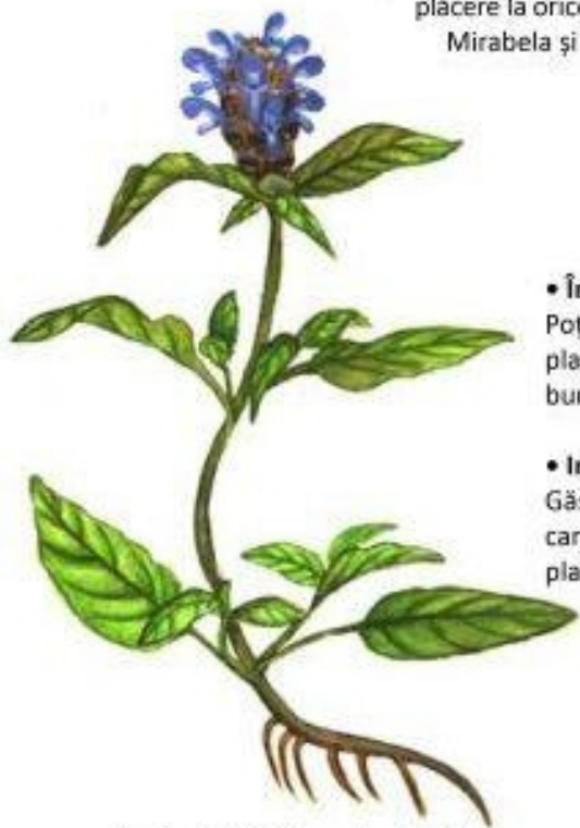
Busuioc sălbatic (prunella vulgaris): una din plantele preferate ale bunicii.