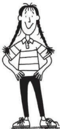
Ruby ilustrată de Nick Sharratt

Traducere din engleză de Ecaterina Godeanu