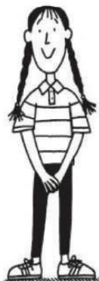
Garnet ilustrată de Sue Heap