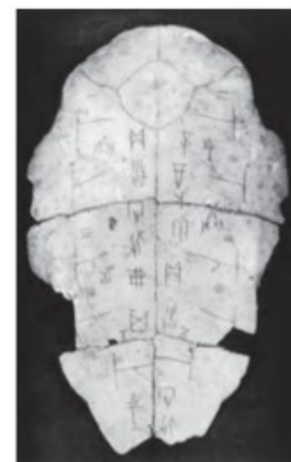
Un exemplu de Chia-ku-wen sau „scriitură pe os și scoică”, pe o carapace de broască-țestoasă, circa 1300-1100 î.e.n.