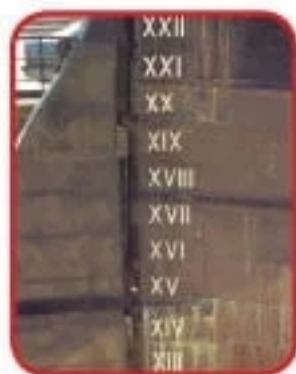
Cifre romane pe Cutty Sark, aflat la Greenwich, Londra

Numeralele (cifrele și numerele) romane sunt simboluri grafice, mai exact litere, care au fost folosite în civilizația antică romană și apoi în Europa, până în momentul în care s-au impus cifrele arabe, în jurul anilor 1300 d.Hr. Vreme de aproximativ 2000 de ani, aceasta a fost modalitatea în care s-au scris cifrele și numerele în Imperiul Roman și în Europa!