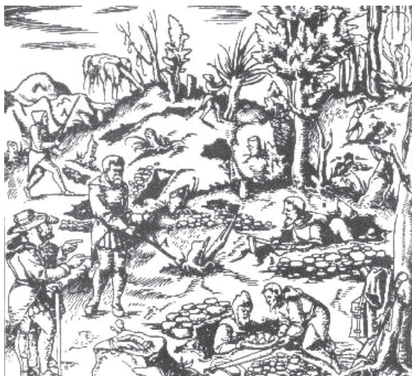
Radiesteziști în căutare de minerale (Imagine din secolul al XVI-lea, Germania)

Templele din antichitate au fost, de asemeni, ridicate în zone puternic radiate, exact cum s-a întâmplat și cu bisericile de origine romană. Locuitorii Romei au ales drept loc de execuție a Sfântului Paul zona celor trei fântâni, din apropierea orașului. Ulterior, aici a fost construită Mănăstirea Trefontana, unde s-au evidențiat de-a lungul timpului foarte mulți călugări valoroși.