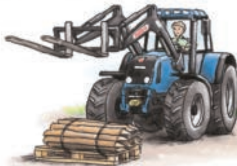
furcă pentru paleți

Un tractor cu încărcător frontal este un vehicul cu brațe mobile, de care se pot atașa o cupă, un clește pentru baloturi sau o furcă pentru paleți. Aceste unelte pot fi schimbate rapid în funcție de necesități.