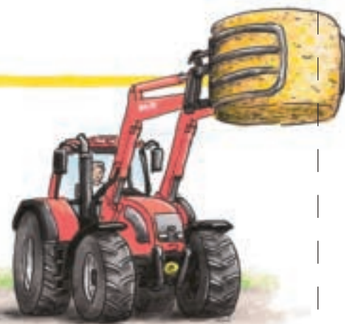
clește pentru baloturi