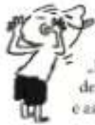
Lothar „E cel mai slab la învățtură de la noi din clasă. De câte ori e ascultat, face el ce face și n-are voie să iasă în recreație.”