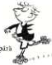
Gil „Tatăl lui Gil e foarte bogat și-i cumpără tot ce vrea.”