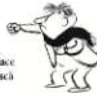
Eusebiu „E cel mai forțos și-i place la nebunie să-i pocnească în nas pe colegi.”