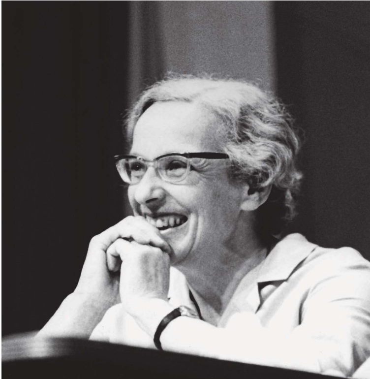
Marie-Louise von Franz 1915-1998