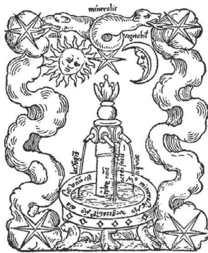
Logoul Fundației de Psihologie Jungiană, Küsnacht, Elveția: Fons mercurialis din Rosarium Philosophorum , 1550 („Fântâna vieții“)