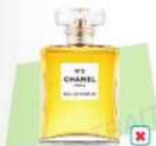
le parfum N° 5 de Chanel