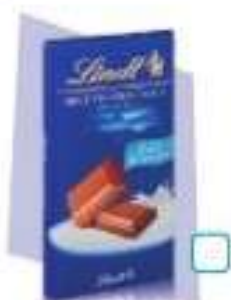
le chocolat Lindt