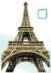
la tour Eiffel