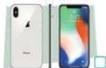
le iPhone X