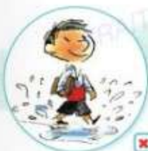
le petit Nicolas