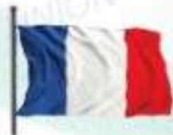
le drapeau français