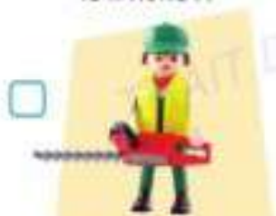
les jouets Playmobil