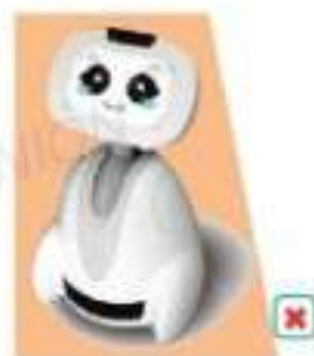
le robot Buddy