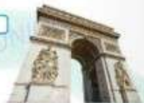
l'Arc de Triomphe