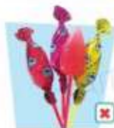
les sucettes Pierrot Gourmand