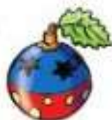
Une décoration de Noël