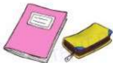
Des affaires de classe

Qu'est-ce que tu as dans ton sac à dos ? Donne le nom et la couleur.