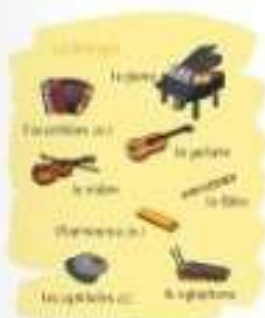
Tu apprends des mots nouveaux.