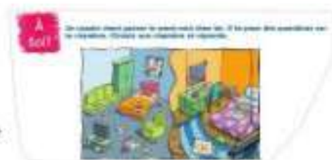
Tu utilises tout ce que tu sais dans un échange avec un copain.