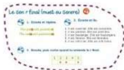
Tu entends, tu prononces, tu reconnais les sons du français.