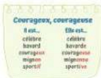
Tu découvres la grammaire.