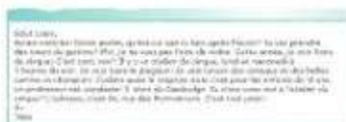
Tu lis des textes plus longs.