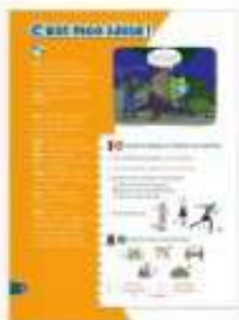
Tu comprends des dialogues.