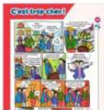
Tu sais lire des images.