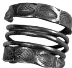
Inel dacic de argint din secolul I d.Cr. Face parte din tezaurul de la Măgura, județul Teleorman.

Iar la sud de ei se găseau tracii. Mulți istorici cred, pe baza unei singure propoziții a istoricului grec Herodot (secolul al V-lea î.Cr.), că și geto-dacii erau o ramură a tracilor. Astăzi se pare că nu e chiar așa. Ar fi fost rude apropiate ale tracilor, dar limbile (puținul cât a mai rămas din aceste limbi) nu se potrivesc sută la sută, nu avem la geto-daci aceleași nume de localități,