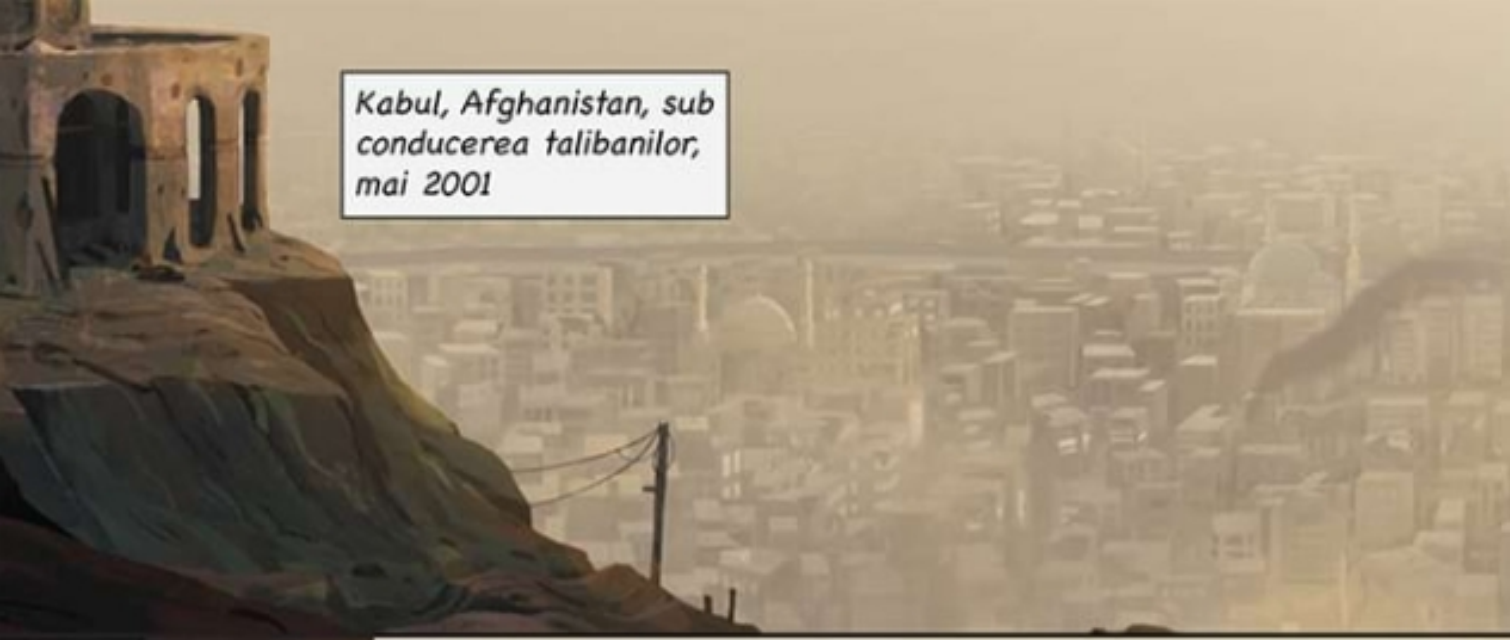
Kabul, Afghanistan, sub conducerea talibanilor, mai 2001