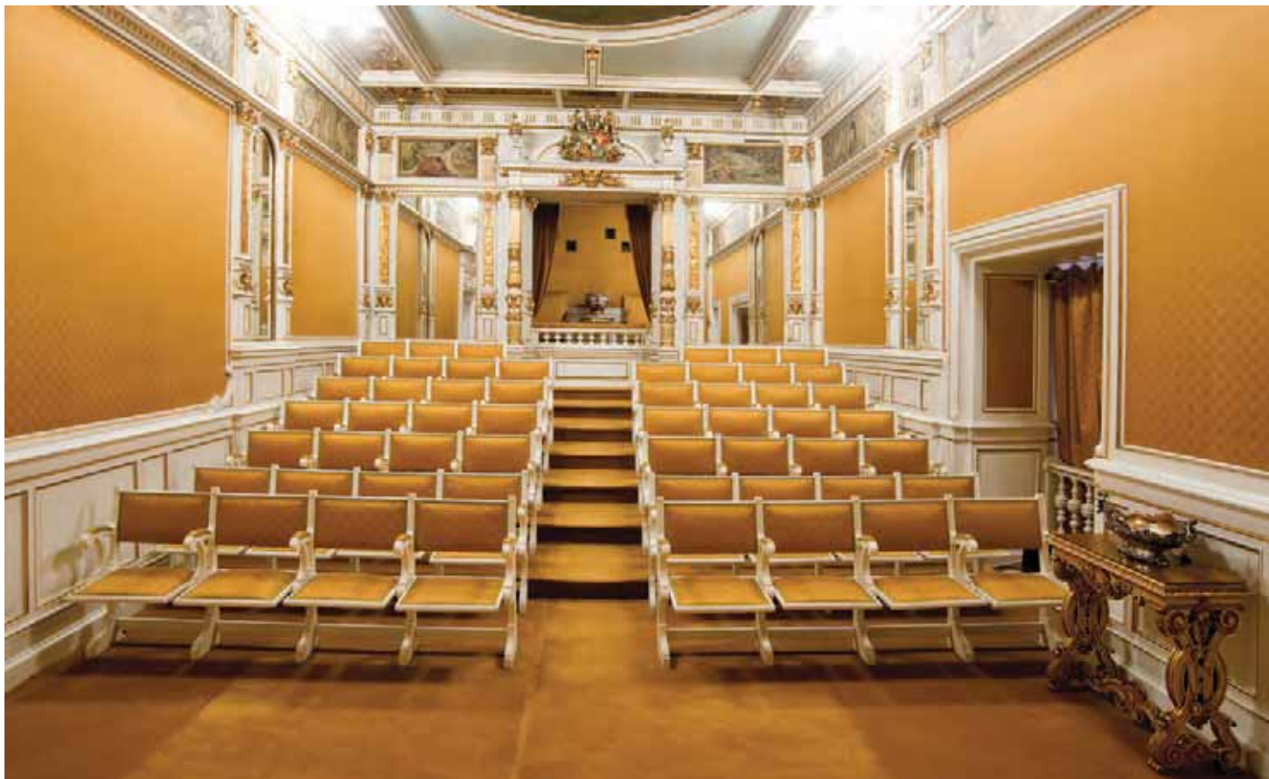
Sala de teatru, vedere de ansamblu spre vest, cu loja regală.

Pe pagina 237: Sala de teatru, Putti muzicanti , după Luca della Robbia (1400–1482), atelier italian, începutul secolului al XX-lea.