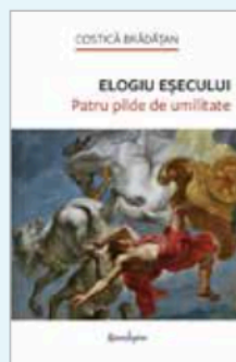
Elogiul eșecului. Patru pilde de umilitate , de Costică Brădățan Traducere de Vlad Russo Editura Spandungino, 2024