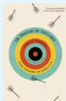
In Praise of Failure , de Costică Brădățan Harvard University Press, 2024