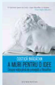
A muri pentru o idee , de Costică Brădățan Traducere de Vlad Russo Humanitas, 2018