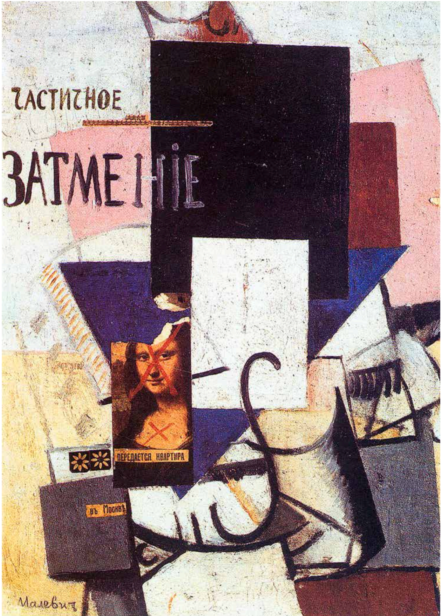
Composition with Mona Lisa, Kazimir Malevich, 1914