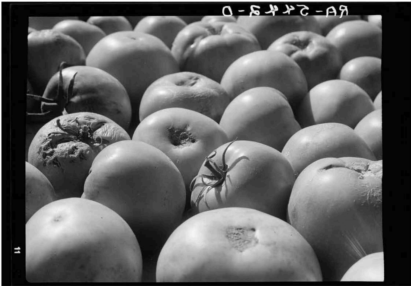
Tomatoes grown by homesteader, Arthur Rothstein, 1936