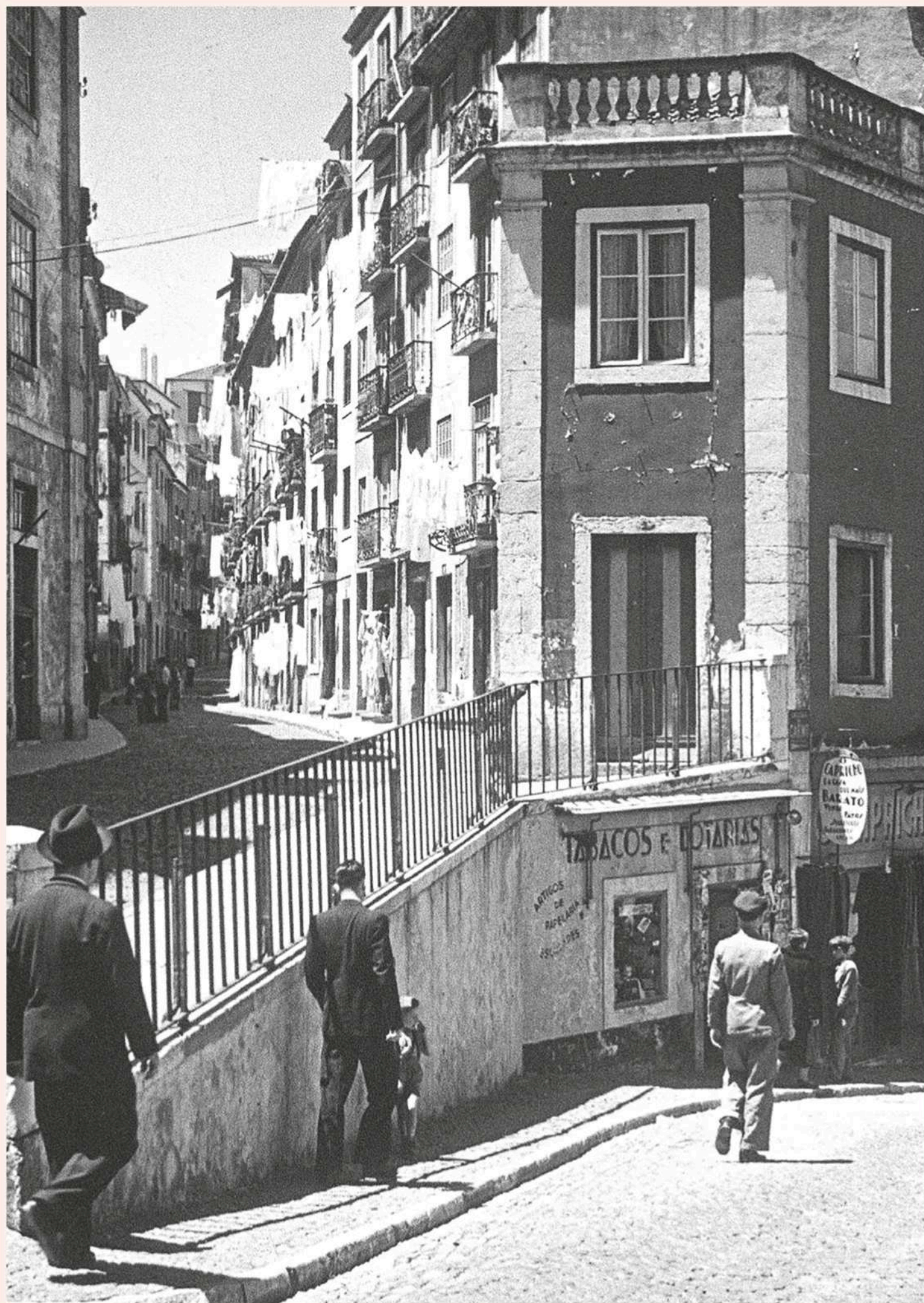
Reisefotos Portugal, Lissabon, Straßenbild