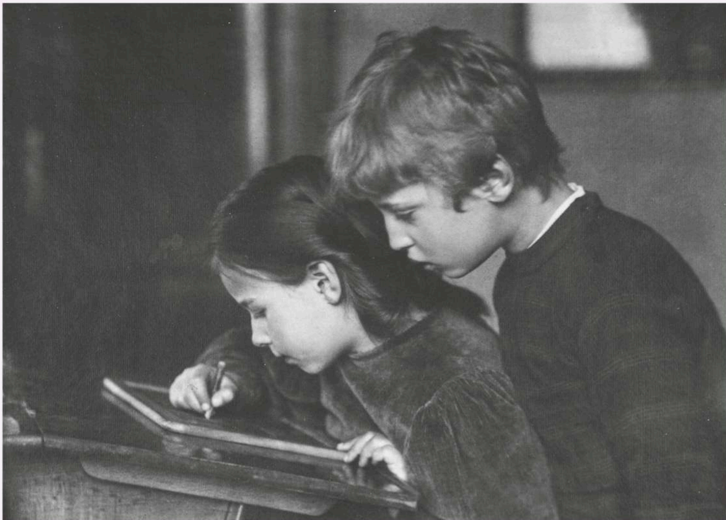
Brother and Sister, Heinrich Kühn

dacă se desfășoară în altă parte, în aer liber sau în librării. Dar cu profesorii e mai ușor să rămâi în legătură și dacă întâlnirile ies bine, ei te invită din nou, la clase noi.