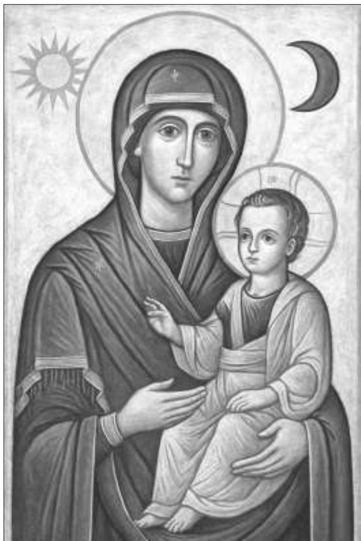
Maica Domnului și pruncul Iisus: Luna și Soarele. Ilustrație ChatGPT.