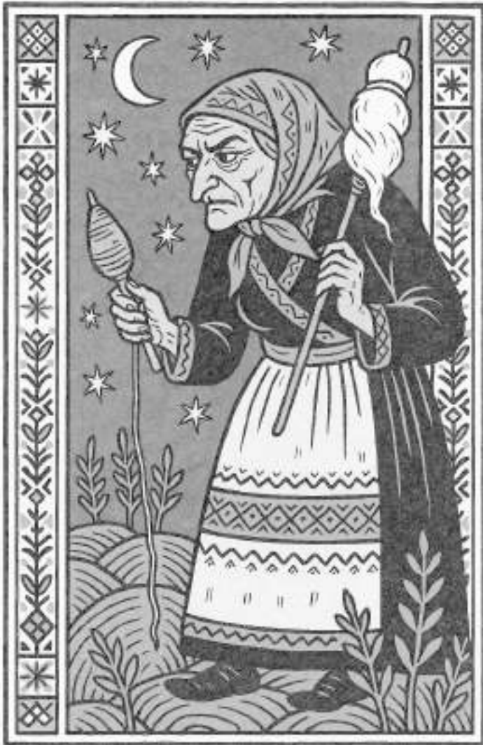
Marțoala, personificarea românească feminină a planetei Marte. Ilustrație ChatGPT.