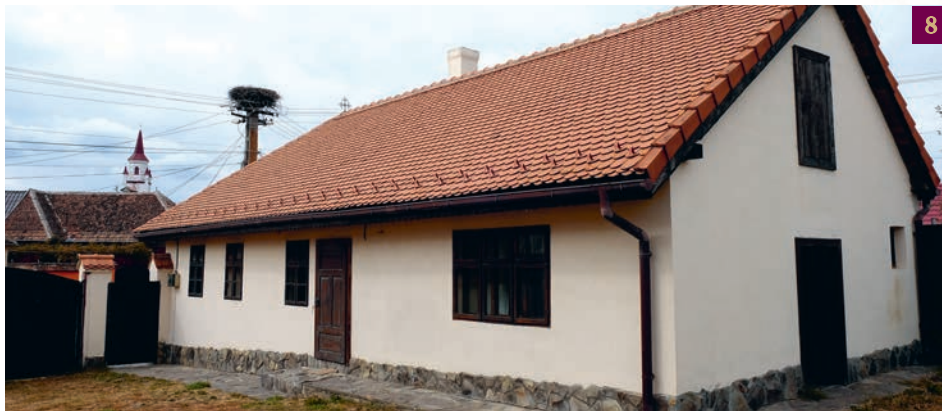
7-8. Casa memorială „Dumitru Stăniloae” din satul Vlădeni