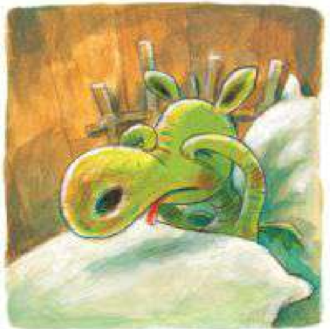
Urmel se trezește, cascade și se freacă la ochi.