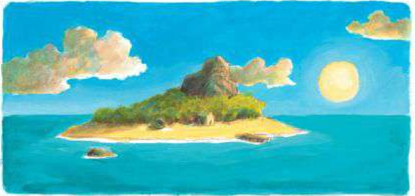
O nouă zi pe Titiwu.